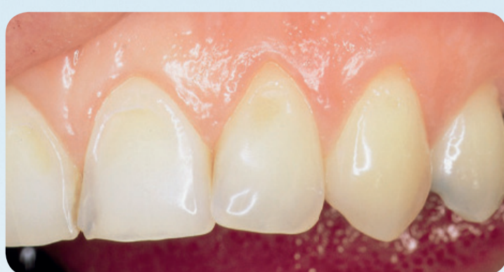
Tanderosion hos en ung pige, der spiser alt for mange sure frugter. Den øverste halvdel af tænderne er blevet flad og lidt gul, fordi noget af emaljen er ætset væk.