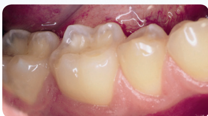
Tanderosion hos en sportsmand, som har drukket alt for mange sure sportsdrikke. Emaljen på tænderne er ætset og slidt, så den er helt tynd og gennemsigtig.