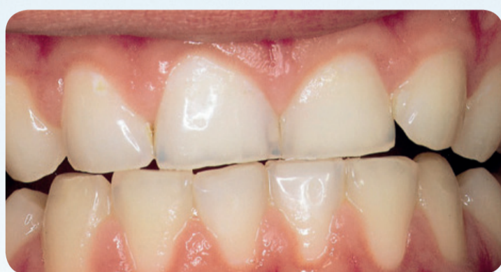
Tandslid og tanderosion hos en ung mand, der skærer tænder og drikker meget sodavand og cola.