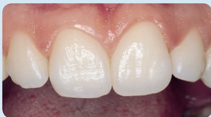
Sunde fortænder hos en 17-årig ung mand, hvor emaljen har bevaret sin fine overflade.